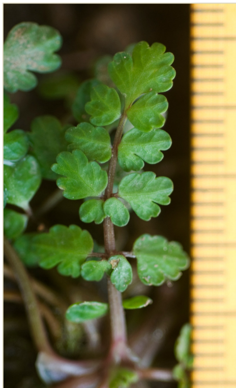
Fig. 2. Detalle de una hoja de Helosciadium bermejoi (en cultivo).

dimensión decimétrica. Esta forma de crecimiento también es responsable de su propagación asexual.