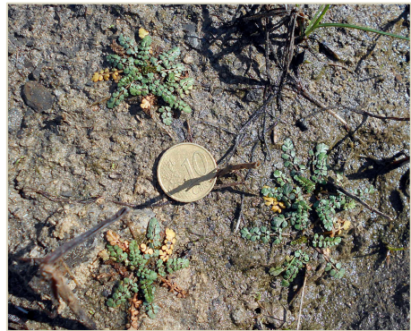
Fig. 1. Rosetas de Helosciadium bermejoi (en el medio natural).

liente (Fig. 1). Los folíolos de la mitad inferior de la hoja presentan en su borde basioscópico un característico lóbulo completamente independiente que suele erguirse respecto del plano de la hoja (Fig. 2).