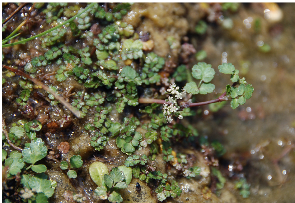
Fig. 5. Ramas con umbelas de Helosciadium × clandestinum sobresaliendo entre el césped de Helosciadium bermejoi (en el medio natural).

se entremezclaban con céspedes típicos de H. bermejoi (Fig. 5). Semanas más tarde, en una visita al Jardín Botánico de Sóller, se detectaron igualmente ejemplares con características intermedias entre las dos especies en una parcela donde se exhibía H. bermejoi . La existencia de este posible híbrido fue comunicada a la Conselleria de Medi Ambient, Agricultura i Pesca del Govern Balear , que es la autoridad competente en especies protegidas, y se tomó la decisión de erradicar tanto los posibles híbridos como toda la nueva población de H. bermejoi y los H. nodiflorum que se encontraban en contacto o alrededor de los puntos donde vivía H. bermejoi . Se pretendía evitar el riesgo de que este híbrido pudiera propagarse y poner en riesgo la supervivencia de la especie protegida. Igualmente se dio el aviso al Jardín Botánico de Sóller sobre el riesgo que suponían la presencia de este posible híbrido.