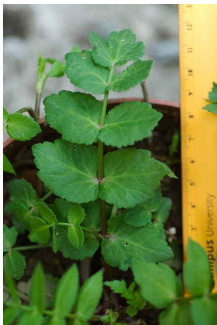
Fig. 3. Detalle de una hoja de un ejemplar inmaduro de Helosciadium nodiflorum (en cultivo).

2012). Sin embargo, otros insectos voladores (coleópteros, dípteros e himenópteros) también visitan sus flores y son capaces de dispersar el polen. El pedúnculo floral se vuelve reflejo en la fructificación lo que se ha interpretado como un mecanismo de autocoria. H. bermejoi vive en el lecho de un pequeño torrente estacional, puede quedar ocasionalmente sumergido pero en general ocupa los suelos húmedos de su margen.