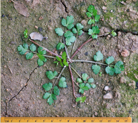
Fig. 6. Ejemplar inmaduro de Helosciadium × clandestinum (en cultivo)

numbers: 16819, H2; 16820, H3; 16821, H4 and 16822, H5.