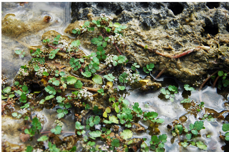
Fig. 4. Helosciadium × clandestinum en el medio natural.

Núm. 65 de 15/05/2008) se crearon nuevas poblaciones. En una de ellas, Mongofre Vell, hay un pequeño torrente estacional donde se forman algunas pequeñas charcas que se secan en verano. Meses más tarde de la siembra en esta localidad se detectaron algunas plantas de H. nodiflorum , que fueron extraídas. Sin embargo, en la primavera de 2016 dentro de un proyecto de seguimiento de esta especie, financiado con una beca del Institut Menorquí d'Estudis , nos encontramos que la zona había sido colonizada de forma masiva por H. nodiflorum apareciendo tanto las formas típicas en las charcas como los plastodemos de pequeñas dimensiones sobre suelos húmedos. También se localizaron ejemplares que presentaban características claramente intermedias entre H. bermejoi y H. nodiflorum , eran plantas rastreras con hojas y estolones de mayores dimensiones que las de H. bermejoi , con umbelas compuestas pero de pocos radios (la mayoría con solo dos) y flores blancas (Fig. 4). Estos ejemplares eran muy vigorosos y